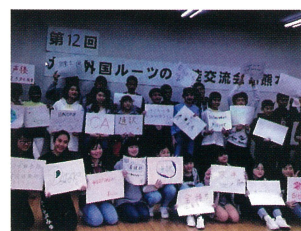
2019年度第12回交流会の様子

各地の外国にルーツを持つ子どもたちが、共に集い、母語でお互いの思いを語り合い、夢や悩みを共有し、自身の存在に誇りを持てるきっかけになるように、毎年この交流会を企画しています。今年度も、高校生を中心とする生徒実行委員会の面々が実施に向けて熱心に取り組んでいましたが、新型コロナウイルスの感染拡大の影響を受け、実施を延期せざるを得ない状況となりました。