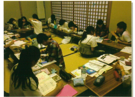
↑国際交流会館での勉強タイム