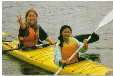
↓夏のカヌー体験の様子